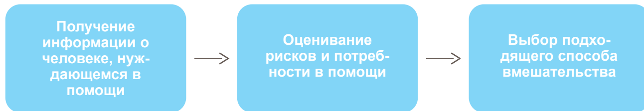
Рисунок 1. Шаги для урегулирования случая НБО