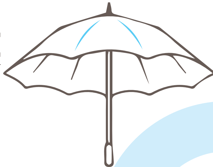
Рисунок 2. Сотрудничество как зонтик

Хорошее сотрудничество – как зонтик над головой жертвы: все стороны должны способствовать тому, чтобы жертва не «промокла» (образно говоря, в продолжение сравнения с зонтиком).